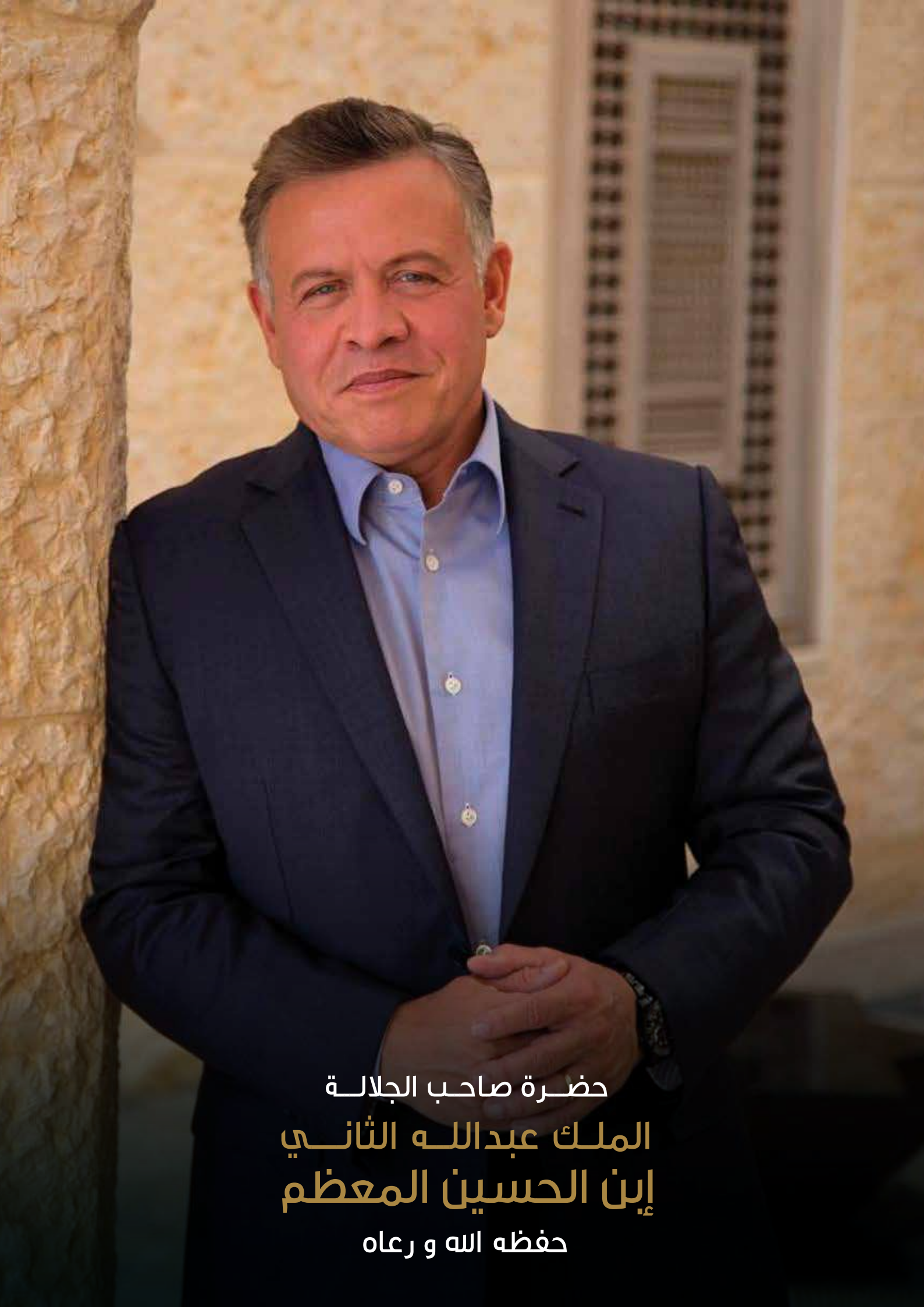
حضرة صاحب الجلالة الملك عبدالله الثاني إبن الحسين المعظم حفظه الله و رعاه