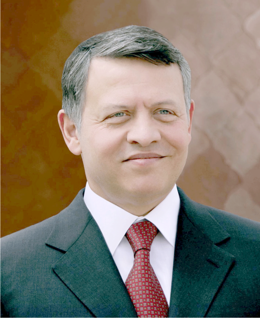
صاحب الجلالة الهاشمية الملك عبدالله الثاني ابن الحسين حفظه الله