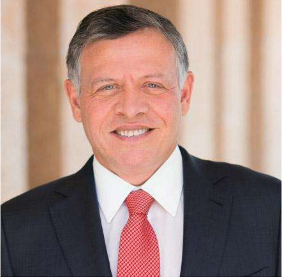
حضرة صاحب الجلالة ملك المملكة الأردنية الهاشمية عبدالله الثاني بن الحسين المعظم