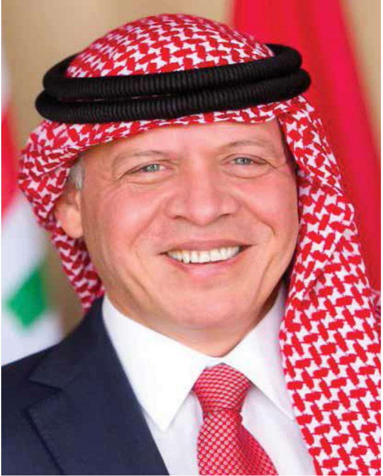
حضرة صاحب الجلالة الهاشمية الملك عبدالله الثاني بن الحسين المعظم (حفظه الله)