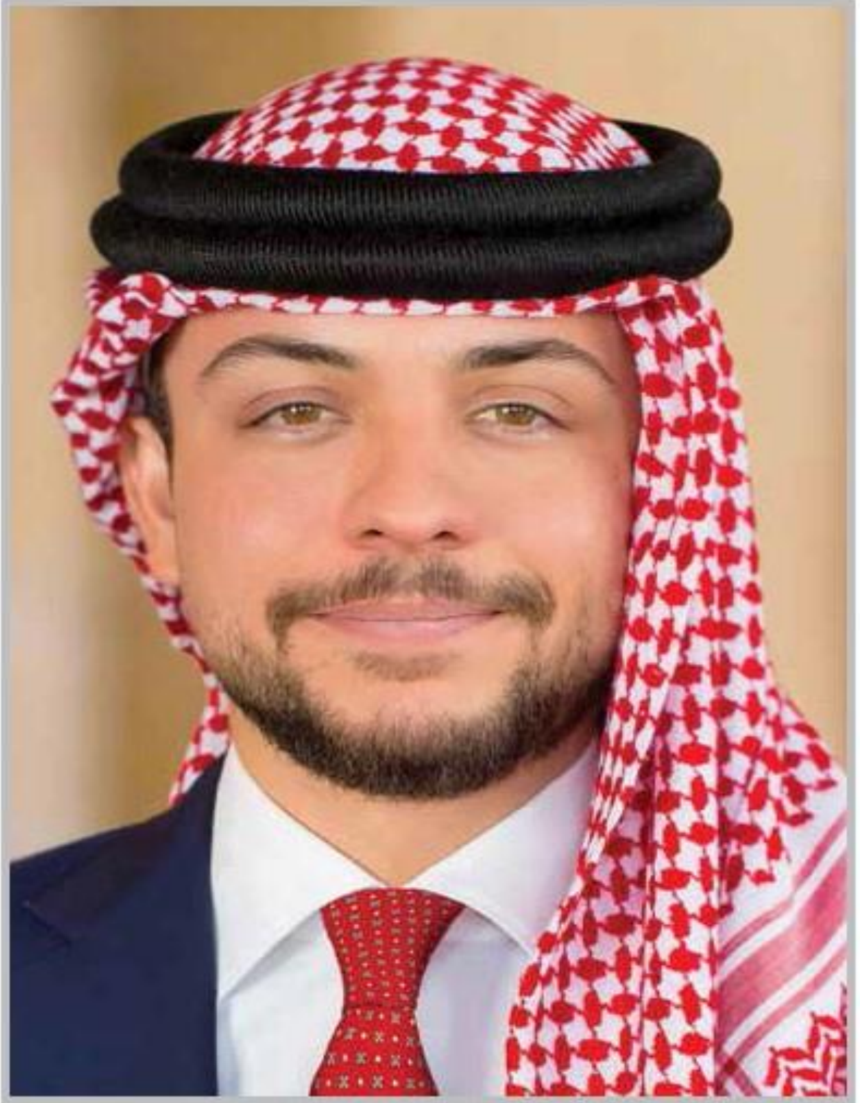
حضرة صاحب السمو الملكي ولي العهد الأمير الحسين بن عبدالله الثاني المعظم