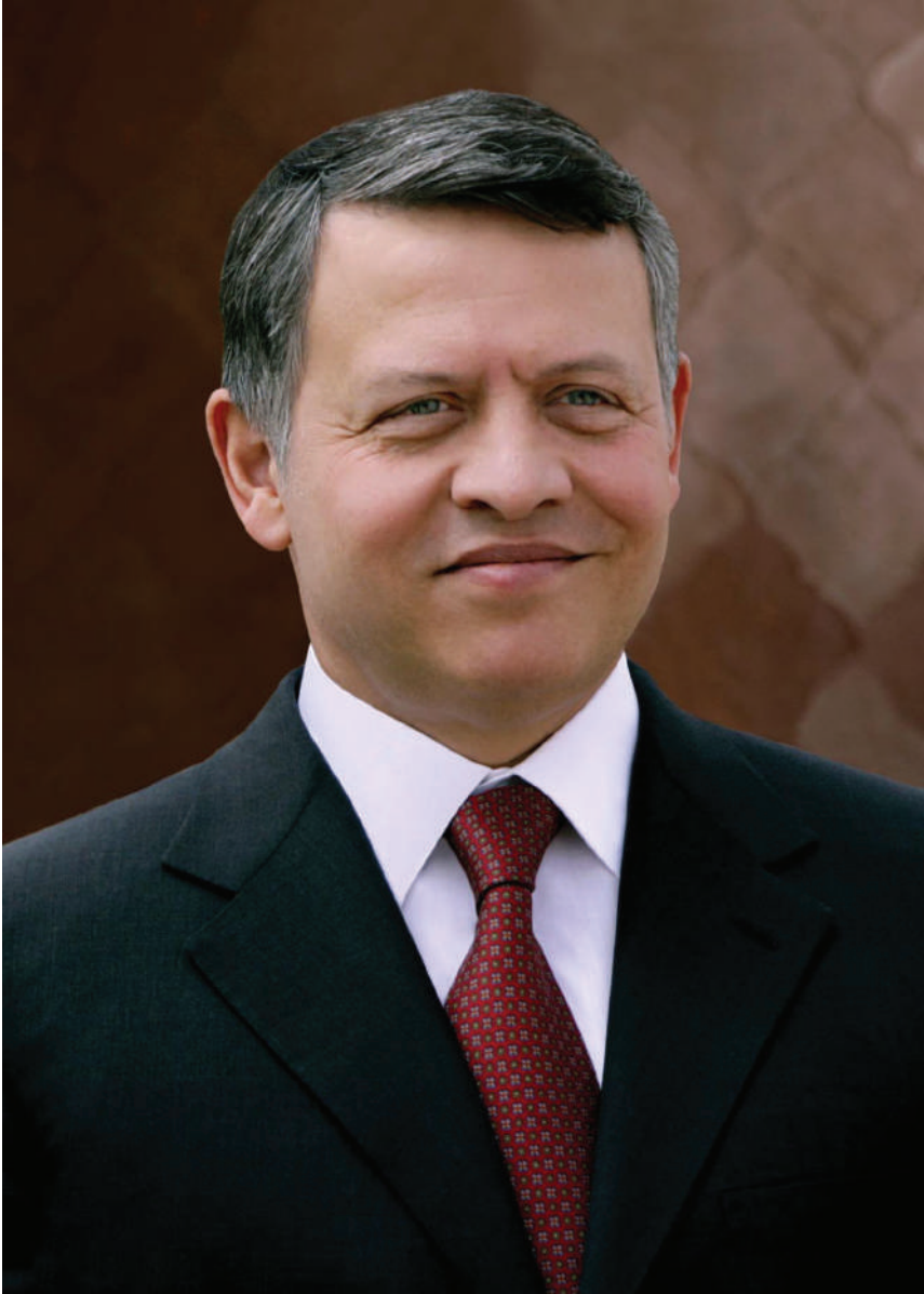
حضرة صاحب الجلالة الملك عبد الله الثاني بن الحسين المعظم