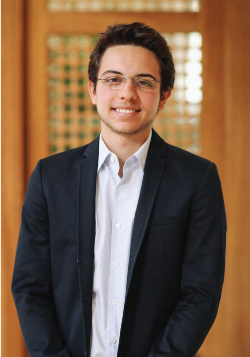
حضرة صاحب السمو الملكي الأمير حسين بن عبد الله الثاني المعظم