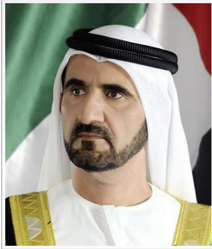
صاحب السمو الشيخ محمد بن راشد آل مكتوم نائب رئيس دولة الإمارات العربية المتحدة رئيس مجلس الوزراء حاكم دبي