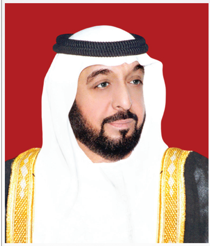
صاحب السمو الشيخ خليفة بن زايد آل نهيان رئيس دولة الإمارات العربية المتحدة