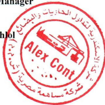
Acct /Salma Saad Zaghlol