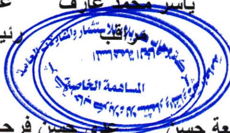
عمار جمعة حسن مندوباً دائرة تسجيل الشركات