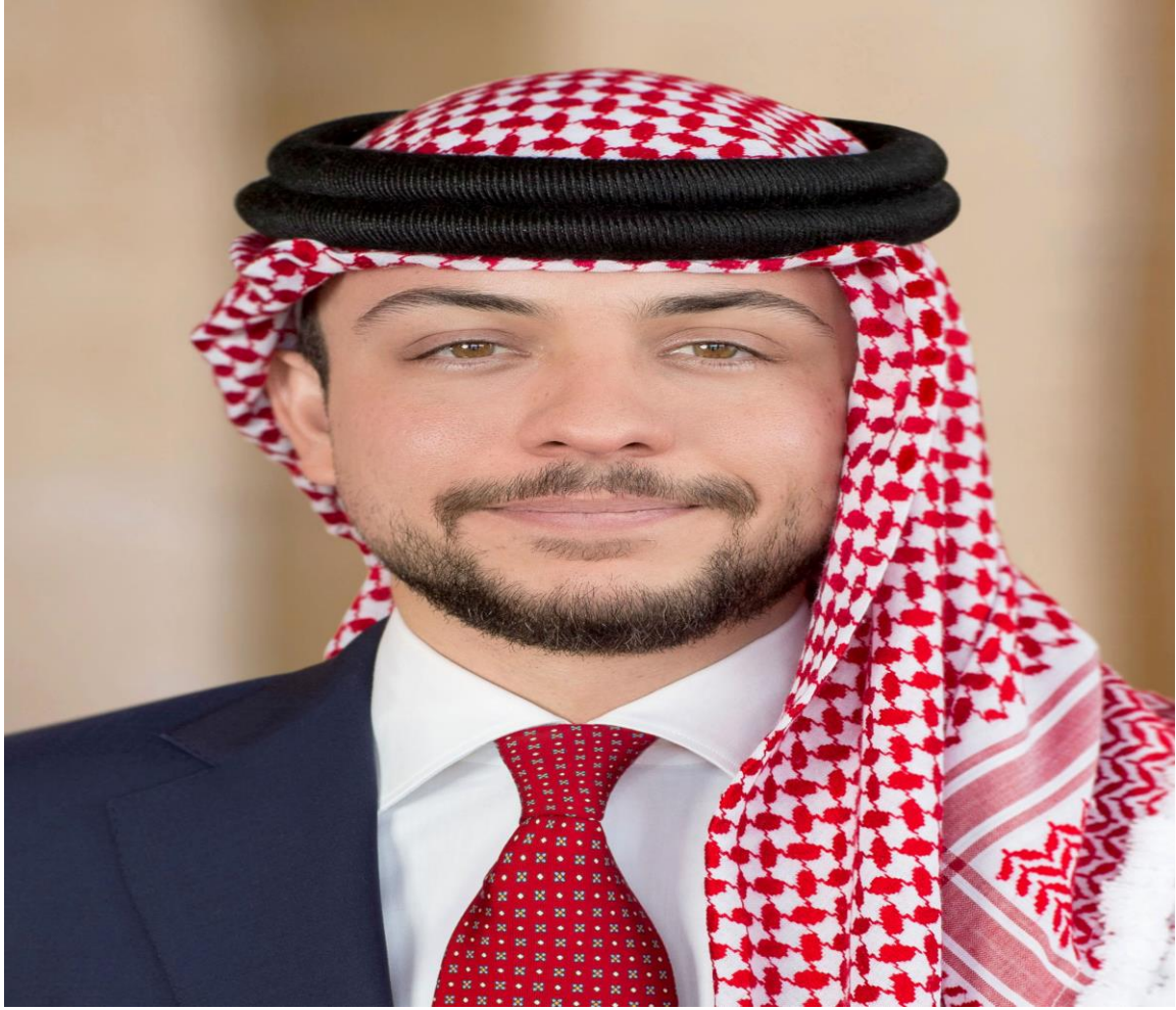
صاحب السمو الملكي الأمير الحسين بن عبدالله المعظم