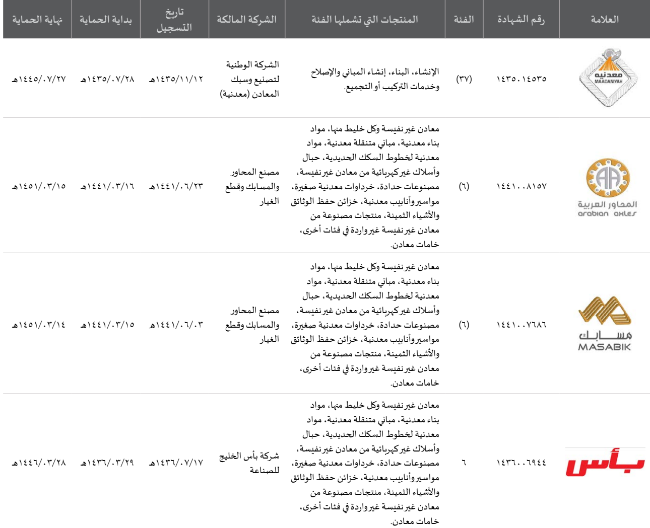
الجدول رقم (٦٤): العلامة التجارية

* انتقلت صلاحية تسجيل العلامات التجارية إلى الهيئة السعودية للملكية الفكرية