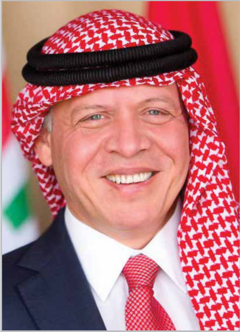
حضرة صاحب الجلالة الملك عبد الله الثاني بن الحسين المعظم