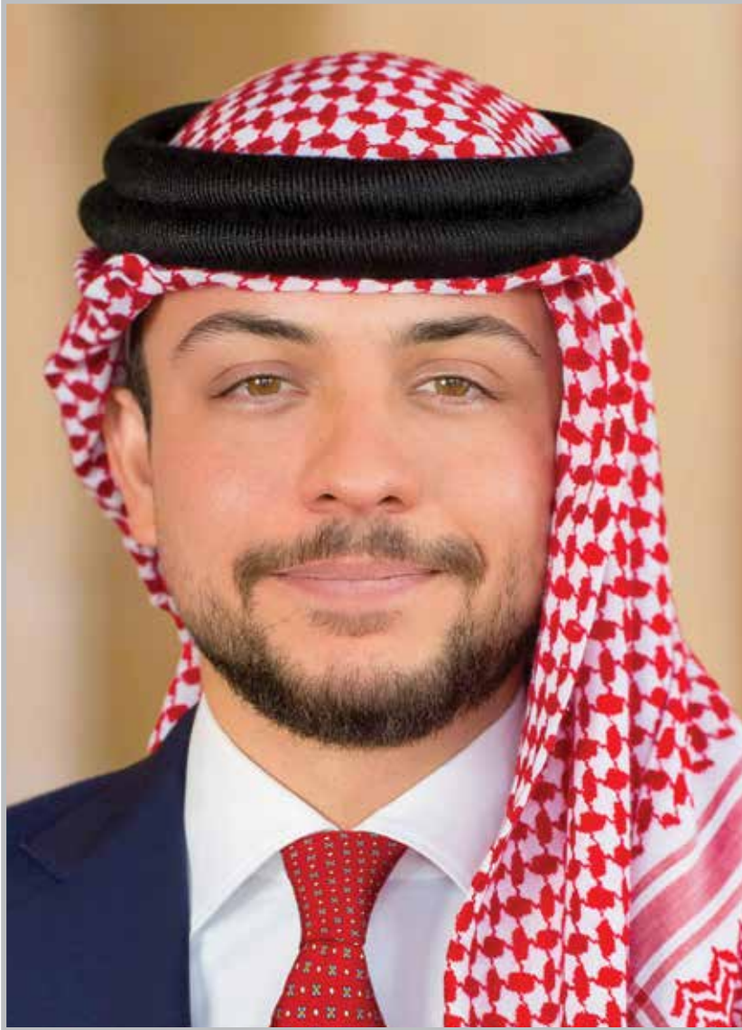
حضرة صاحب السمو الملكي الأمير الحسين بن عبد الله الثاني ولي العهد المعظم