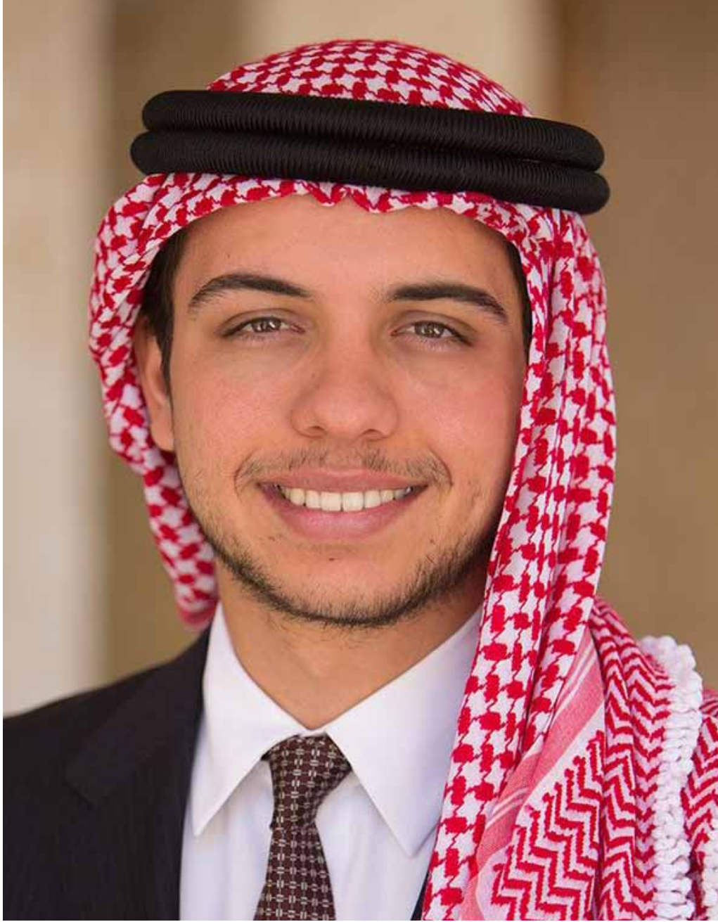
حضرة صاحب السمو الامير الحسين بن عبدالله الثاني ولي العهد المعظم